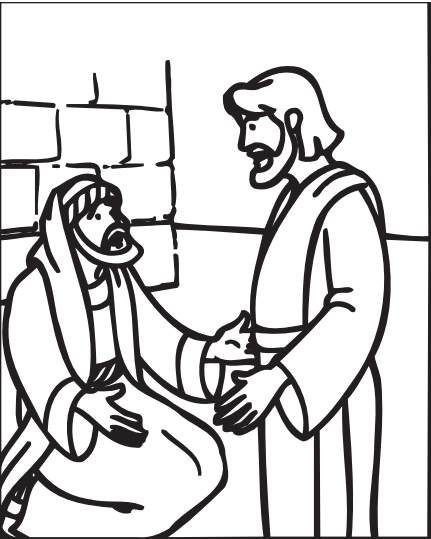
© 2010 Gospel Light. Permission to photocopy granted to the original purchaser only. The Big Book of Bible Story Activity Pages #2